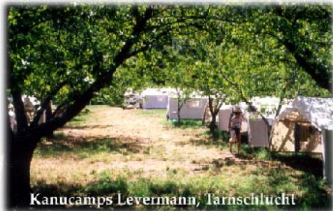
Kanucamps Levermann, Tarnschlucht